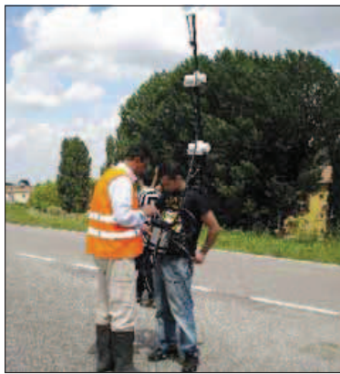
FIGAROLO Strumenti di indagine geologica

Oggi le indagini sui resti del "castello di Ficarolo", riportano alla memoria le epiche vicende di cui fu teatro. Con la gemella fortezza di Goltarasa - Stellata, sua dirimpettaia e ancora esistente, controllava il fiume Po. Entrambe le rocche furono erette a difesa del territorio, a scopi militari. Durante la lotta per le investiture religiose del 1077, sotto la protezione di Matilde di Canossa, la fortezza ficarolese ospitò Papa Gregorio VII, che si opponeva all'imperatore Enrico IV. La fortificazione dovette quindi essere ritenuta