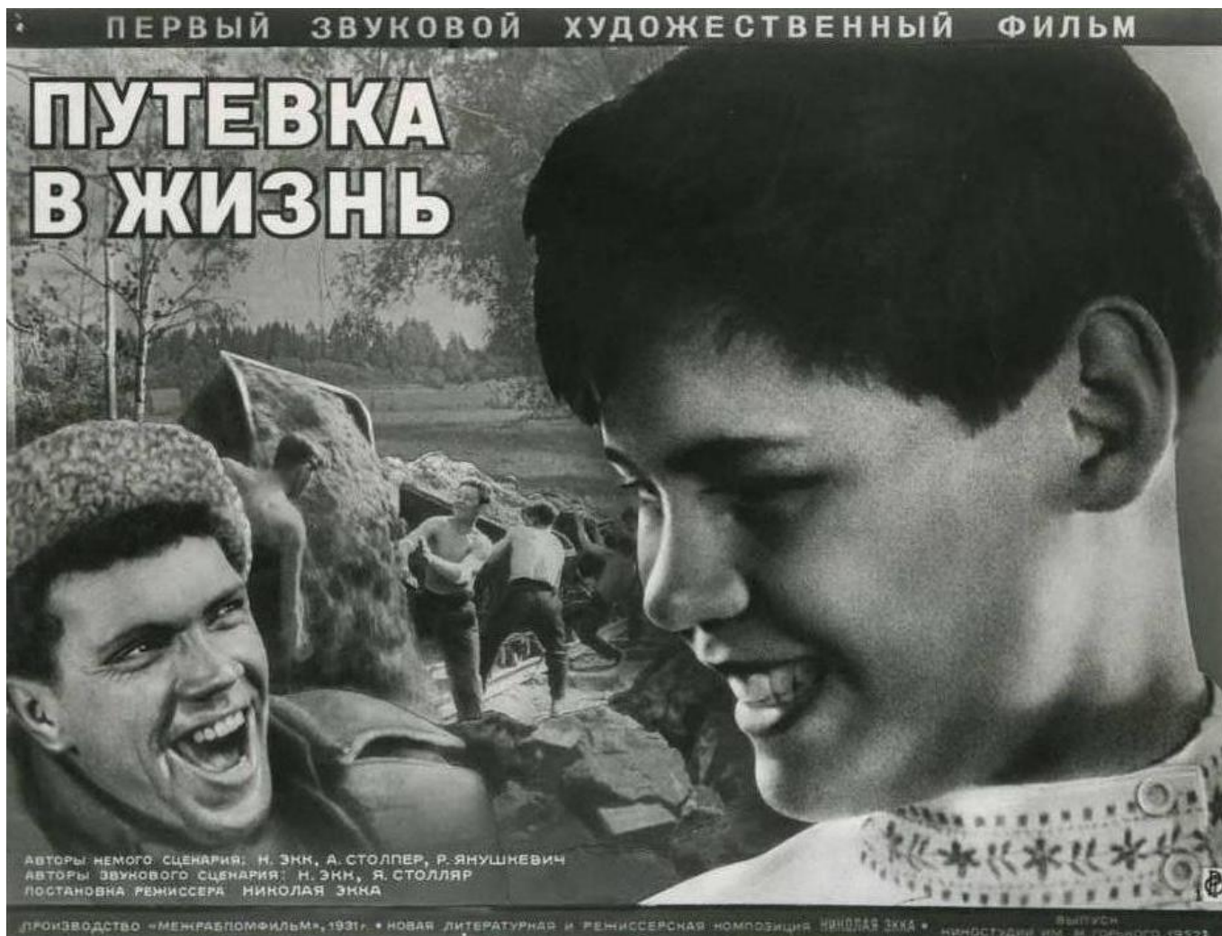
Il cammino verso la vita (Nikolaj Ekk, 1931)