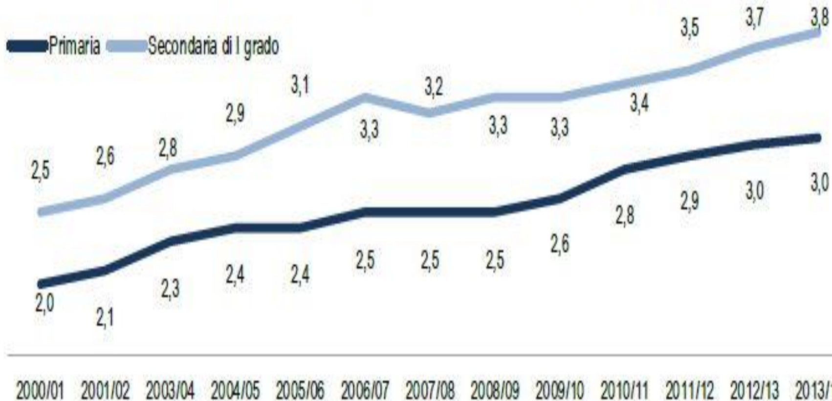
GRAFICO 1. ALUNNI CON DISABILITÀ PER ORDINE SCOLASTICO E ANNO SCOLASTICO. Valori per 100 alunni

□ Censis (2014): disabili nel 2020 saranno 5 milioni